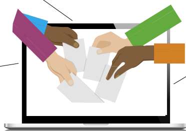
* mêmes données que pour accéder à i-Prof

(pli cacheté remis entre le 5 et le 13 novembre ou réception par mail). Si je perds mon identifiant, je peux en obtenir un nouveau via mon espace électeur ( elections2018.education.gouv.fr ) jusqu'à la clôture du vote.